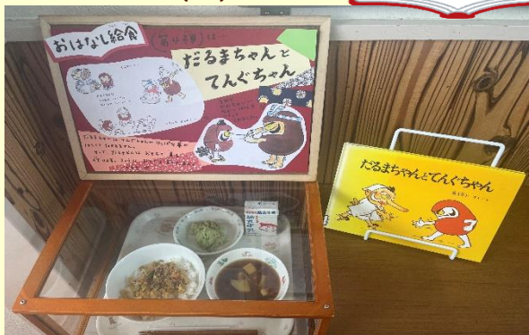
だるまちゃんのずんだもち