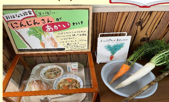
あちちのポトフ~赤いにんじん入り~ お風呂嫌いのごぼうのサラダ