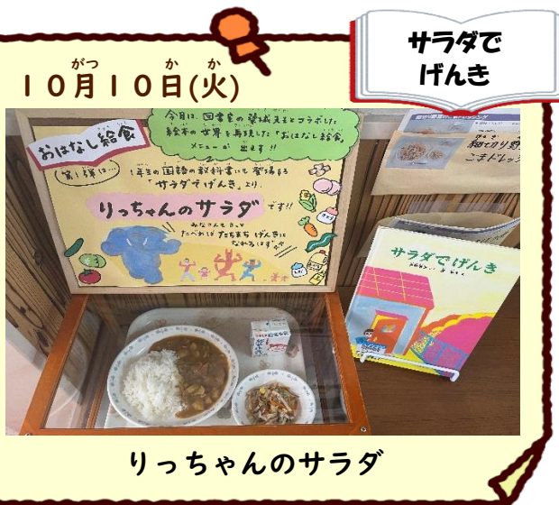
りっちゃんのサラダ

絵本に登場するすみれかぼちゃのプリンを再現したデザートでお誕生日のお祝いをしました。