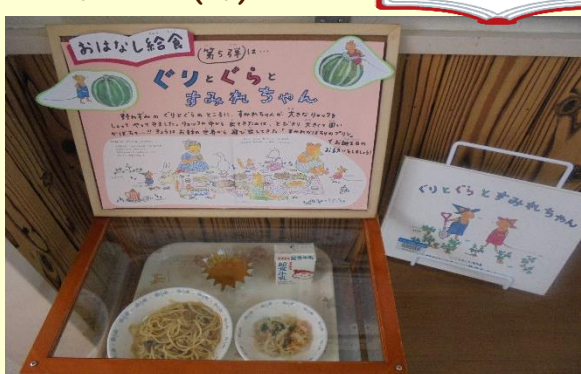
すみれかぼちゃのプリン