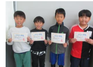
地域清掃を行った3年生