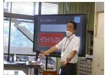
ICT支援員さんから学びました。

12日(月)にはデジタル教科書の効果的な活用方法について研修しました。デジタル教科書は普通の教科書と同じ内容のものがタブレットに映るのですが細部を拡大したり、何度もマーカーを引いたり、必要な図表等を抜き出したりといった普通の教科書では難しい活用ができることを学びました。また、学習したことを各自のタブレットから電子黒板に映したり、自分の考えを説明したり、発表したりする機会を学ぶなど、今後の授業改善に生かします。