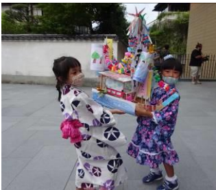
代表でたのも船を流しました。

8月27日(土)、新型コロナウイルスの影響で2年間実施されなかった「たのもさん」が3年ぶりに行われました。今年度1年生から4年生の縦割り班でつくった4隻のたのも船と、2年間流せなかったたのも船8隻を、12家族に流していただきました。参加者からは「家族の思い出になった。」「当日までたのもさんがあるか心配だった。できてよかった。」「たのもさんに参加でき、感動した。」ととてもうれしい感想をいただきました。多くのたのも船が飾られた四宮神社では、たくさんの人が楽しそうに祭りに参加していました。