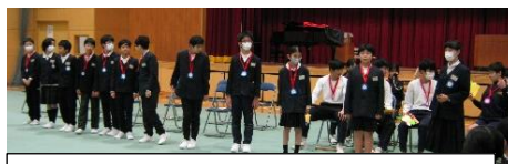
6年生と9年生がスピーチしました