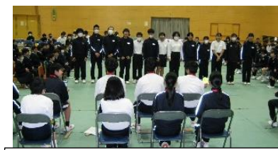
8年生が歌とメッセージを送りました