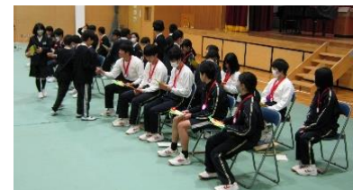
5年生は手紙を書いて一人一人に渡しました