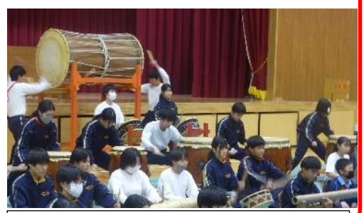
7～9年生が宮島舞紅葉の曲を演奏しました